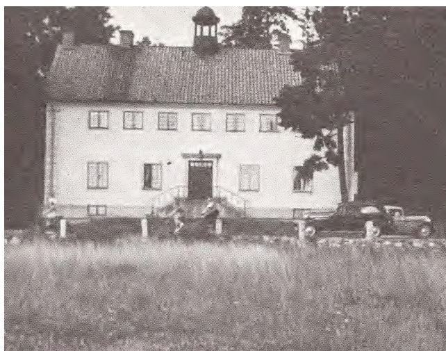
1925 gick landsvägen från Stockholm till Nacka-Värmdö alldeles framför trappan.