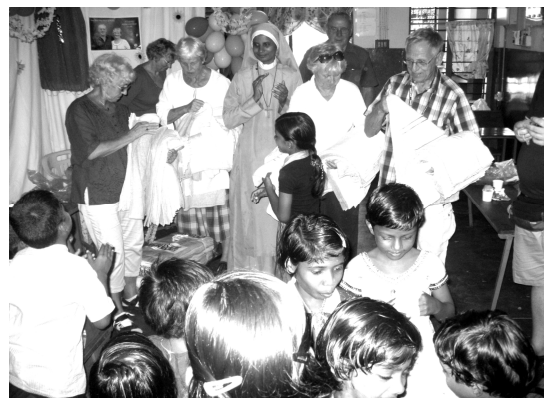
Utdelning av badlakan