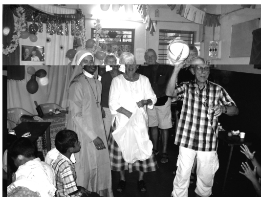
Utdelning av fotbollar och cricketracketar med bollar